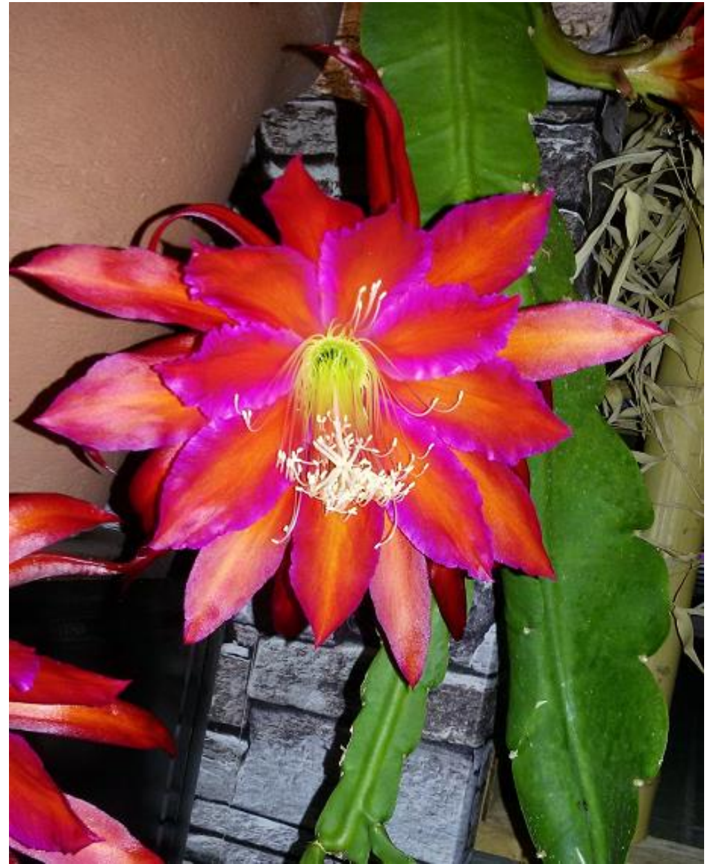
Epiphyllum-Hybride „Lady Ruffles“