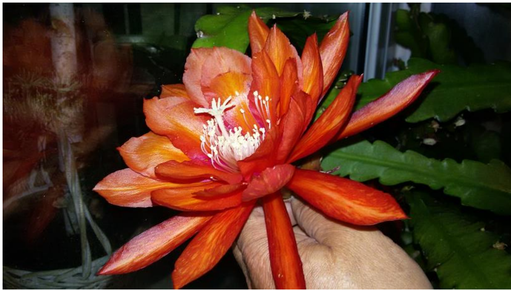
Epiphyllum-Hybride "Flechs Flame"